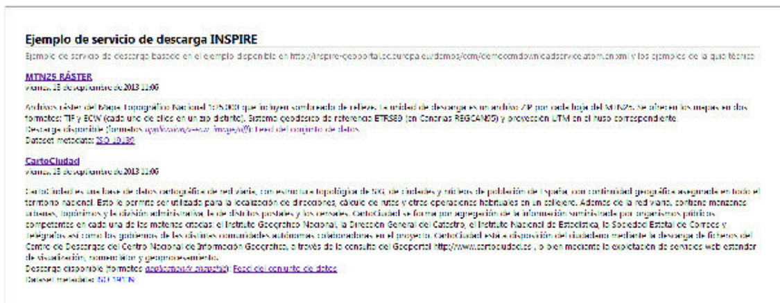
Figura 3: Visualización de la fuente Atom en el navegador Mozilla Firefox.

Internet Explorer presenta la fuente aplicando una hoja de estilo y generando un documento en el que aparecen los contenidos de los elementos “title” de la fuente y, por cada entrada, el contenido de los elementos “title” , “updated” y “summary” de manera secuencial. Sin embargo, no se insertan hipervínculos en los contenidos de los elementos “title” de cada entrada hacia las fuentes de los conjuntos de datos, imposibilitando la navegación. Además, ofrece la posibilidad de filtrar por categorías, palabras clave, etc. y ordenar por título o por fecha.