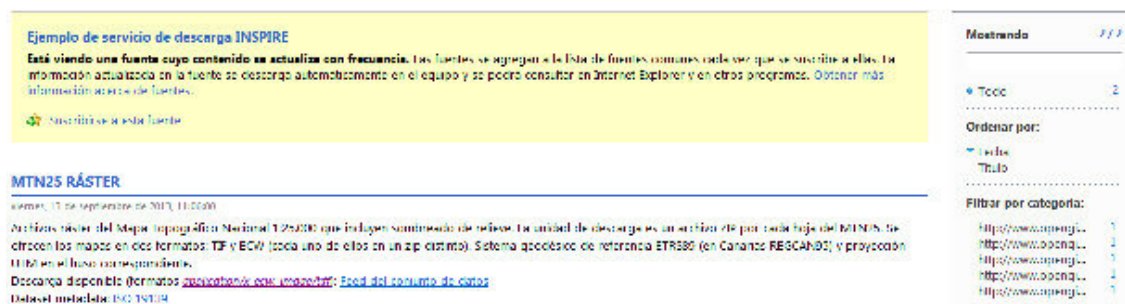
Figura 3: Visualización de la fuente Atom en el navegador Internet Explorer.

Internet Explorer presenta la fuente aplicando una hoja de estilo y generando un documento en el que aparecen los contenidos de los elementos “title” de la fuente y, por cada entrada, el contenido de los elementos “title” , “updated” y “summary” de manera secuencial. Sin embargo, no se insertan hipervínculos en los contenidos de los elementos “title” de cada entrada hacia las fuentes de los conjuntos de datos, imposibilitando la navegación. Además, ofrece la posibilidad de filtrar por categorías, palabras clave, etc. y ordenar por título o por fecha.