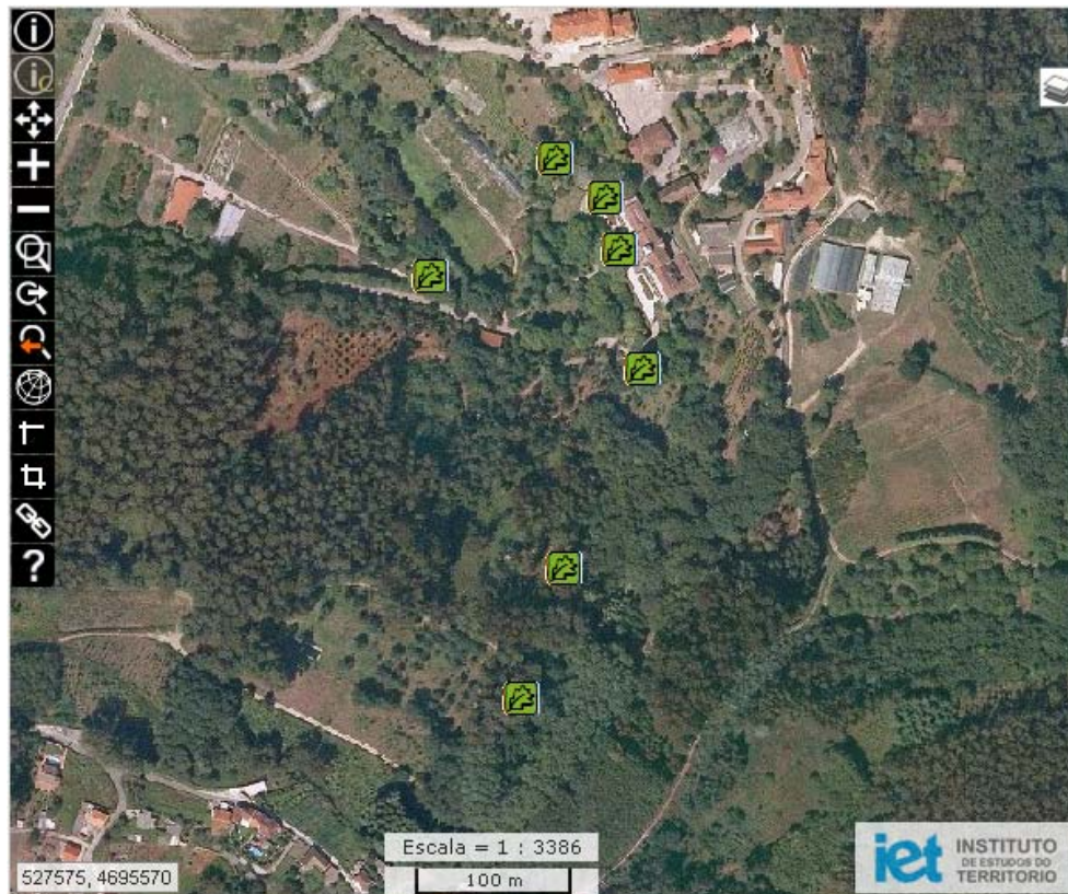
Figura 1. Captura de pantalla del aspecto del Xeovisor Mínimo

Las características más salientables de este visor son las siguientes: