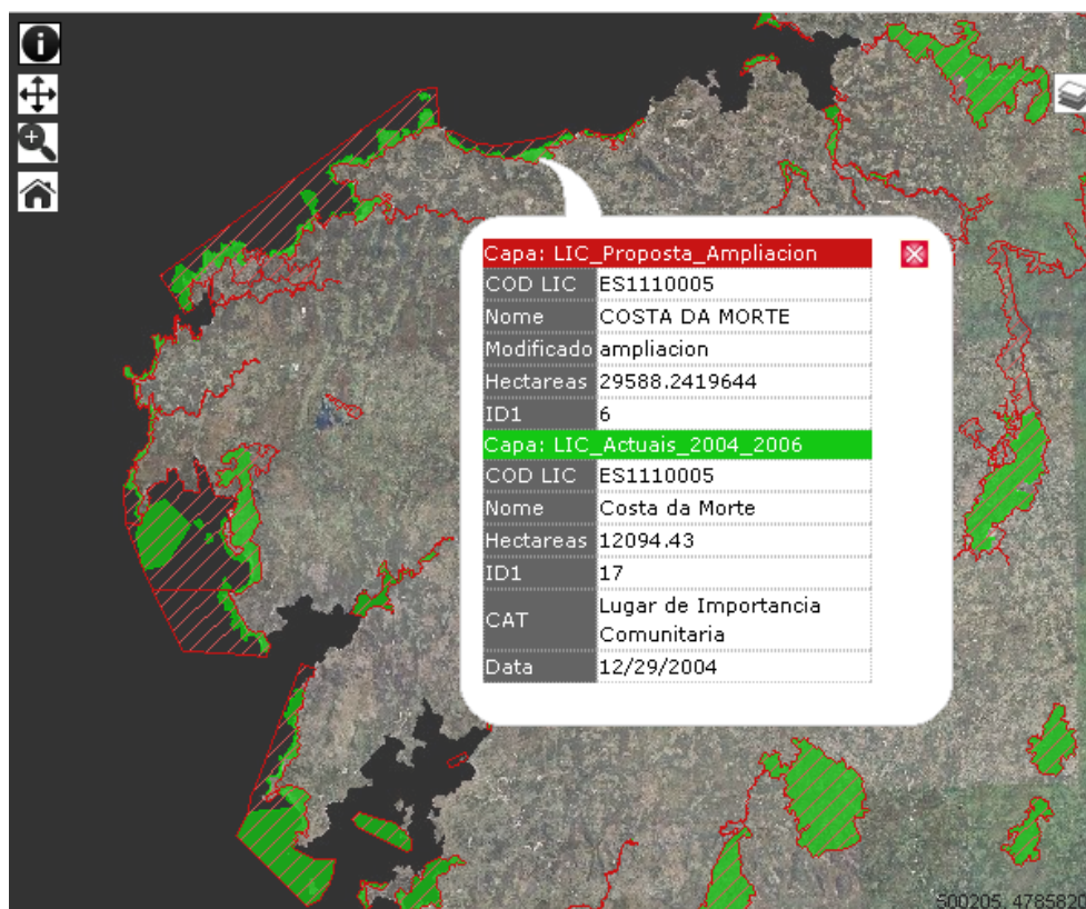
Figura 5. Captura de pantalla del XMV personalizado