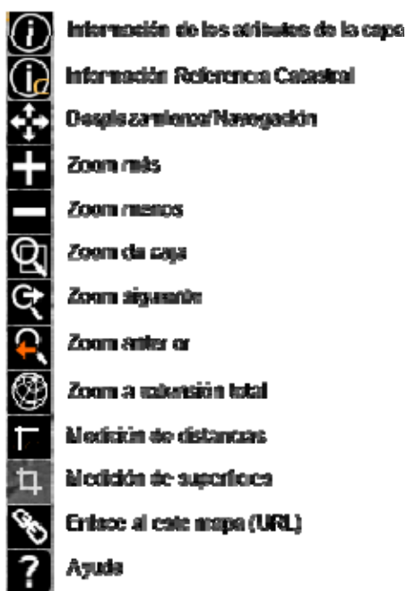
Figura 3. Botonera de herramientas del XVM en su versión actual 1.0.1.

El xeovisormínimo acepta algunos parámetros al invocarlo en la URL (parámetros GET) que permiten por ejemplo la definición de una capa, el encuadre, proyección, idioma, etc. Además, no para su uso embebido y aprovechamiento de las opciones