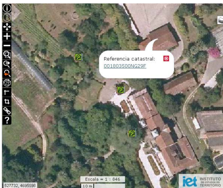
Figura 4. Ejemplo de uso de la herramienta de Información de Catastro sobre una parcela.

La creación de nuevas funcionalidades es una de las estrategias más interesantes a explotar de esta tecnología, ya que permite el máximo aprovechamiento común de los recursos al poder coordinarse los nuevos contratos de ampliación de funcionalidades y revertir en todos los visores basados en el XVM.