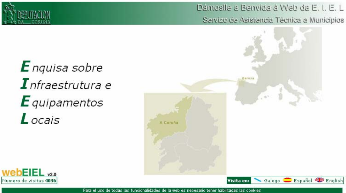
Figura 1. Pantalla inicial de WebEIEL