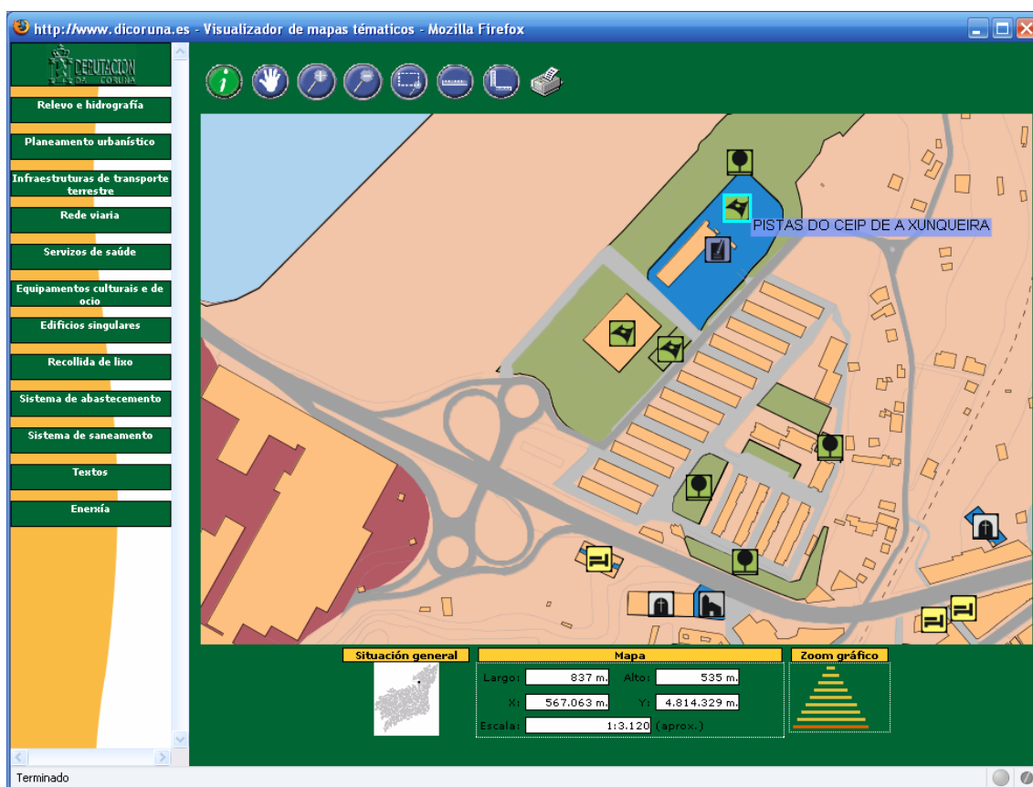
Figura 3. Visualizador de mapas basado en un applet Java

Por otra parte, para los usuarios en general cuyo principal interés es consultar la cartografía, se ha diseñado una versión mucho más sencilla de la interfaz que utiliza imágenes para visualizar la cartografía y está desarrollada utilizando únicamente tecnologías HTML y JavaScript. Esta versión permite que la aplicación pueda ser ejecutada en cualquier navegador web, sin más requisitos. Además, su sencillez hace que sea indicada para usuarios poco o nada expertos en el manejo de sistemas de información geográfica.