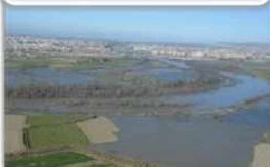
Figura 2. Sector agrícola (Acequia de Peche).

Sector agrícola: área bajo riego en la que se desarrollan diversos cultivos.