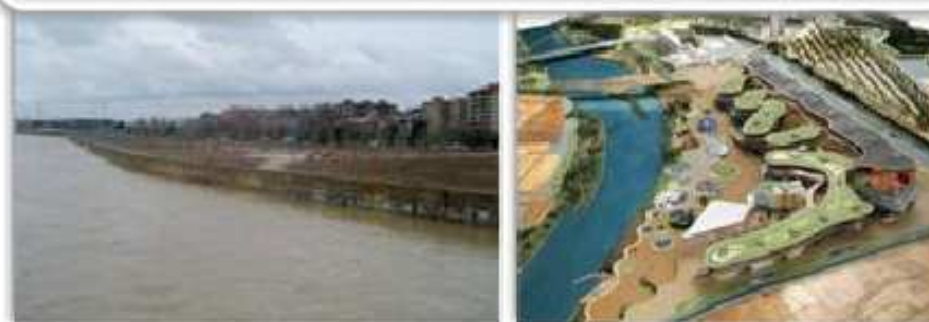
Figura 3. Área urbano-residencial (Actur) y Recinto ferial Expozaragoza (Meandro de Ranillas).

Sector urbano: aérea residencial-comercial y una zona recreativa donde se ubica el Parque Metropolitano del Agua y el Recinto Ferial EXPOZaragoza.