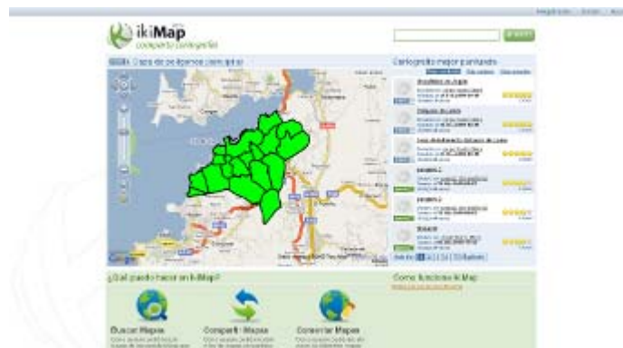
Figura 1. Página de inicio de ikiMap con un mapa aleatorio cargado

En el mundo de la cartografía también se ha visto en los últimos años un gran incremento en el número de aplicaciones orientadas a Internet gracias a la ampliación de los anchos de banda, la mayor capacidad de los ordenadores, y al mejor procesamiento de código por parte de los navegadores web que permiten gestionar interfaces cada vez más ricas y dinámicas.