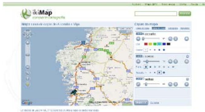
Figura 2. Ejemplo de los controles de atributos de las capas de un mapa

Para conseguir que una herramienta en Internet tenga éxito debe cumplirse una premisa: ha de ser de sencilla de manejar, puesto que es la mejor forma de llegar a un mayor número de usuarios. Así pues, una de las características principales de la interfaz de ikiMap es la facilidad con la que se interacciona con la aplicación.